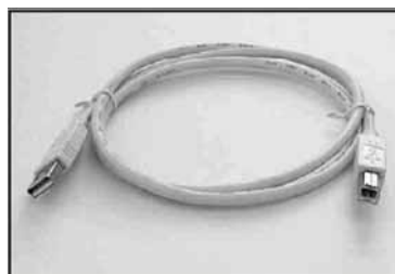
SCUAB-1 вилка A на вилку B, 1 м SCUAB-2 вилка A на вилку B, 2 м SCUAB-3 вилка A на вилку B, 3 м SCUAB-5 вилка A на вилку B, 5 м