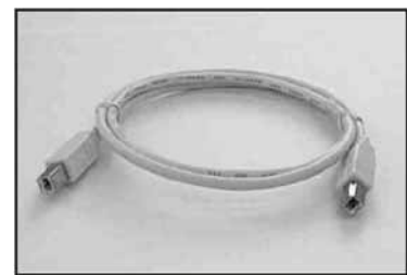
SCUBB-1 вилка B на вилку B, 1 м SCUBB-2 вилка B на вилку B, 2 м SCUBB-3 вилка B на вилку B, 3 м SCUBB-5 вилка B на вилку B, 5 м