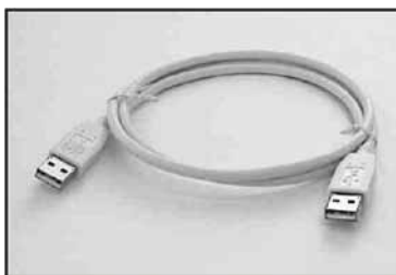
SCUAA-1 вилка A на вилку A, 1 м SCUAA-2 вилка A на вилку A, 2 м SCUAA-3 вилка A на вилку A, 3 м SCUAA-5 вилка A на вилку A, 5 м